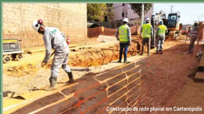
Construção de rede pluvial em Caetanópolis