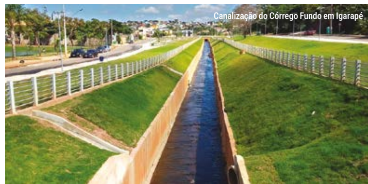
Canalização do Córrego Fundo em Igarapé

Projetos de DRENAGEM E CANALIZAÇÃO em Paraopeba, Caetanópolis e Igarapé.