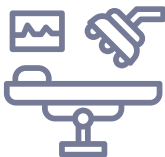
UBS em São Joaquim de Bicas

Implantação de SALAS DE URGÊNCIA em 18 municípios da Bacia do Paraopeba.