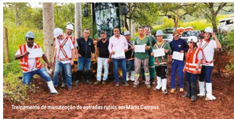
Treinamento de manutenção de estradas rurais em Mário Campos