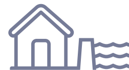
Bacia de contenção B3 - Contagem

Obras estruturais para prevenir enchentes, como a BACIA DE CONTENÇÃO DO CÓRREGO FERRUGEM , em Contagem.