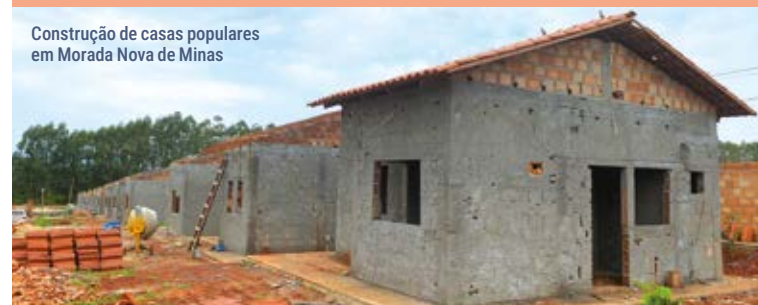
Construção de casas populares em Morada Nova de Minas

Outras 488 CASAS serão construídas na região.