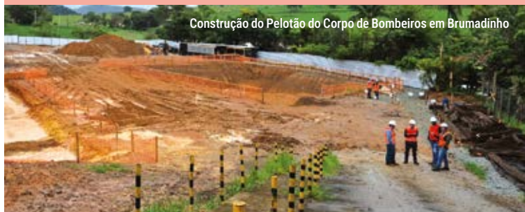
Construção do Pelotão do Corpo de Bombeiros em Brumadinho

Construção de um NOVO PELOTÃO DE BOMBEIROS em Brumadinho.