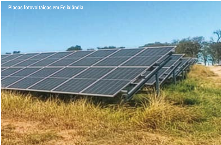
Placas fotovoltaicas em Felixlândia

A 60% na conta de energia pública em Morada Nova de Minas.