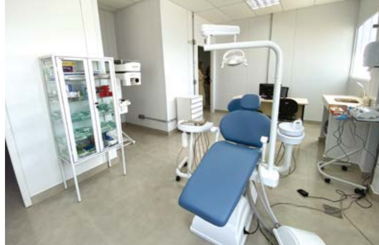
UBS em São Joaquim de Bicas