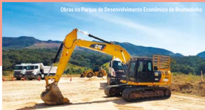
Obras no Parque de Desenvolvimento Econômico de Brumadinho

OBJETIVO: reduzir a dependência econômica da mineração e gerar empregos.