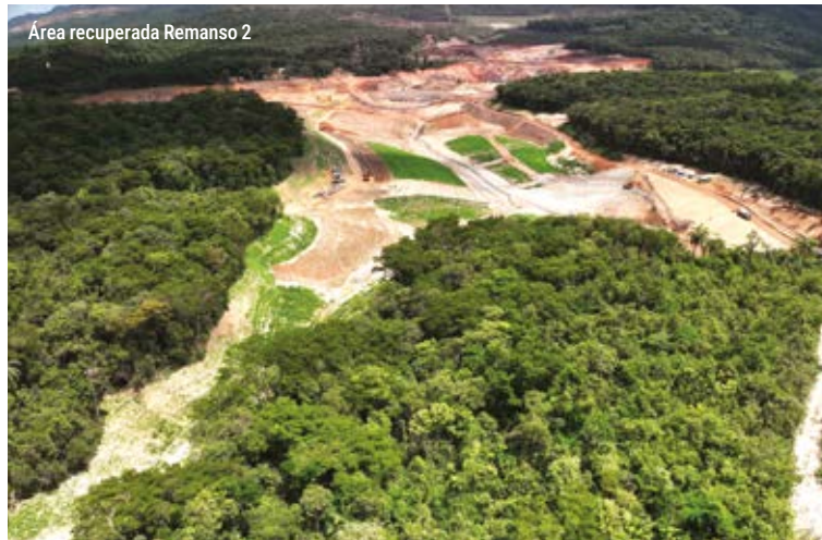
Área recuperada Remanso 2

Previsão de recuperar MAIS 110 HECTARES ATÉ 2026.