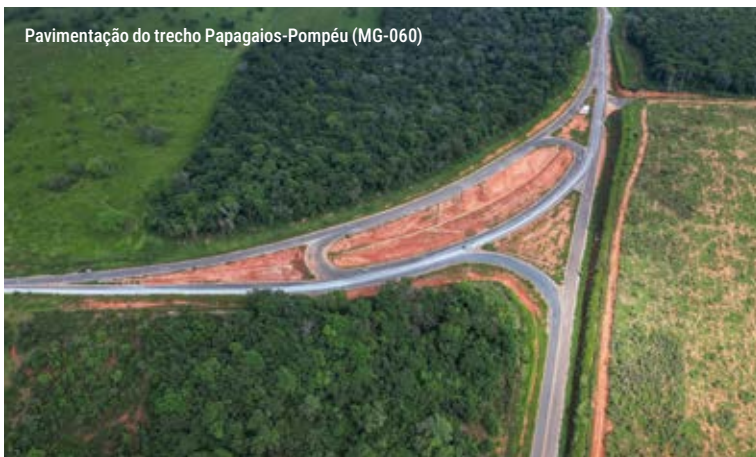
Pavimentação do trecho Papagaios-Pompéu (MG-060)

Em São Joaquim de Bicas, o asfaltamento vai passar de 20% para 90% das ruas.