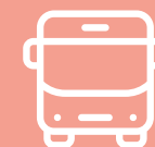
Entrega de ônibus em Três Marias

564 ÔNIBUS NOVOS para o transporte intermunicipal.