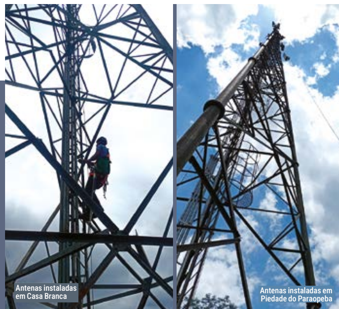
Antenas instaladas em Casa Branca