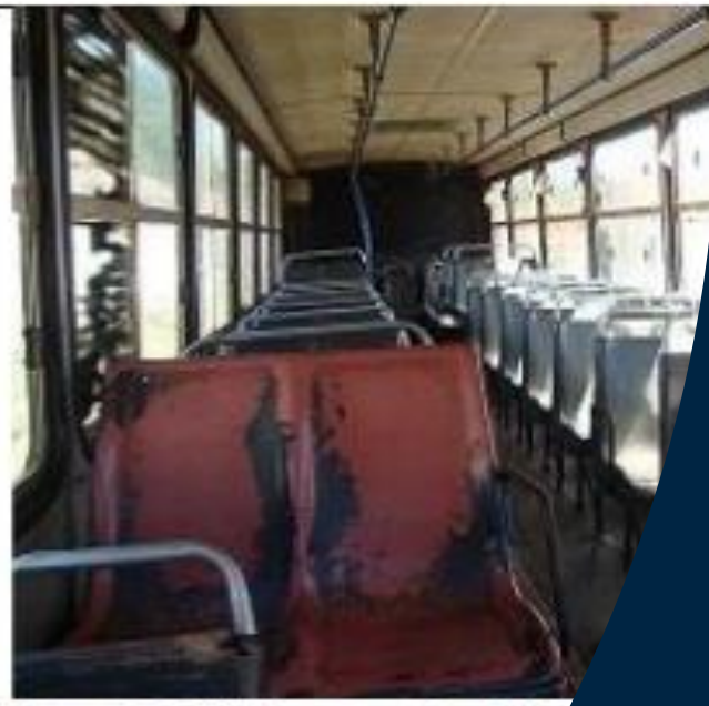
Foto 02: Onibus escolar HPT Aldeias Altas, MA, 3 de agosto de 2016.