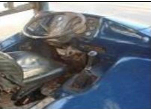
Onibus escolar NFN 6593, ano 2004, Aldeias Altas, MA, 5 de agosto de 2016.