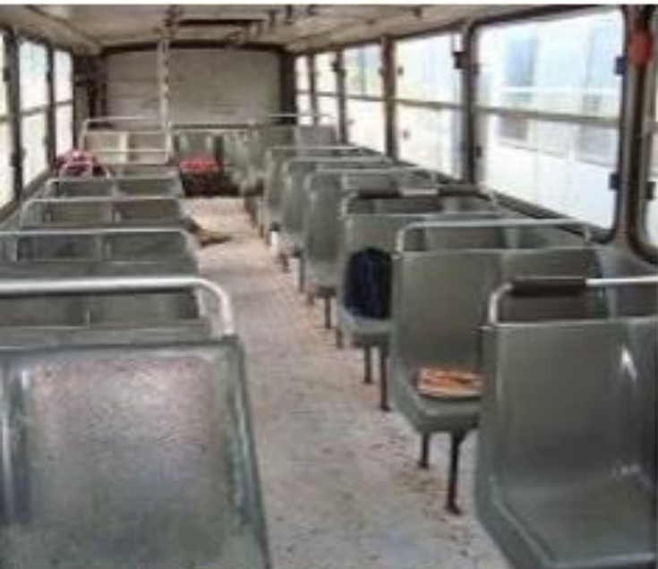
Onibus escolar LVR 6716, ano 2000, Aldeias Altas, MA, 3 de agosto de 2016.