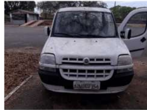
FIAT DOBLO ELX 1.8 FLEX - ANO 2008 MOD.2008