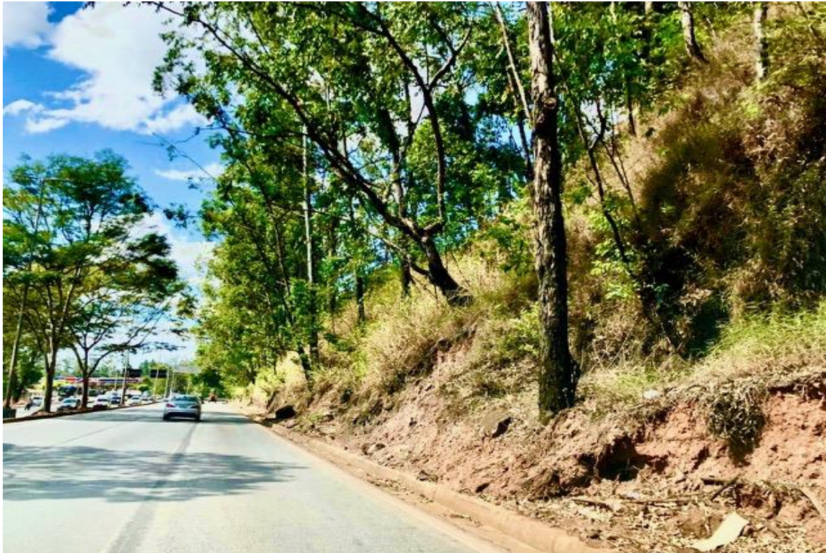
MGC 356 – LE