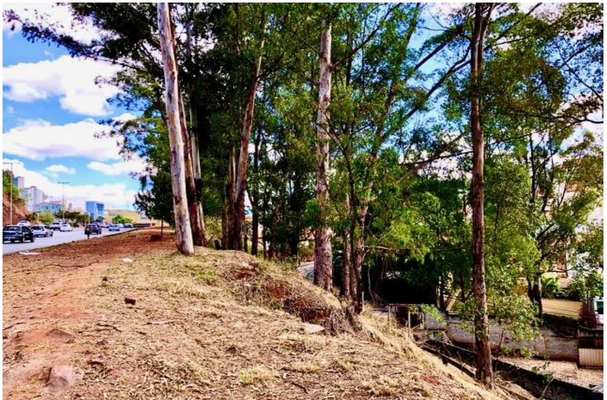
MGC-356 – LD