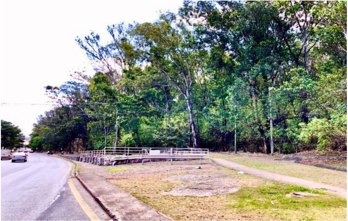
MGC 356 – LE