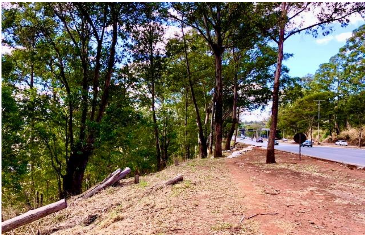
MGC-356 – LD