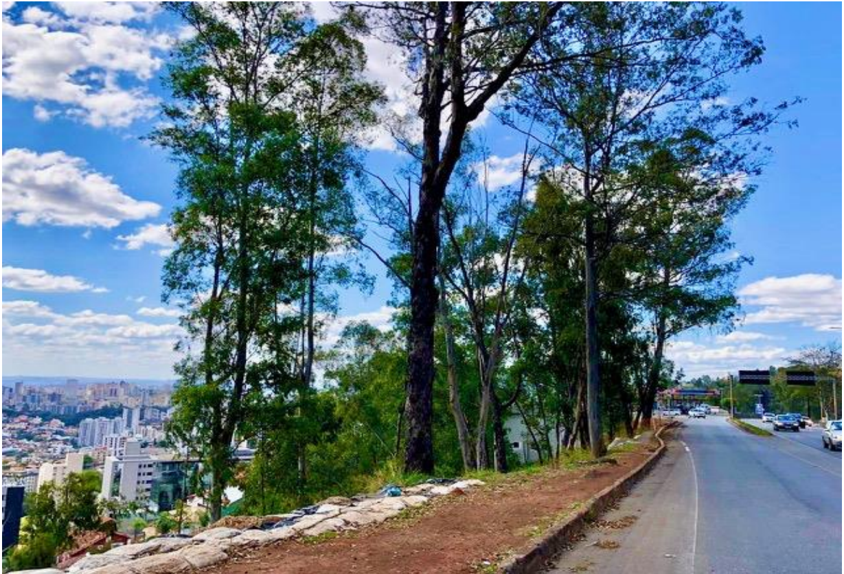
MGC-356 – LD