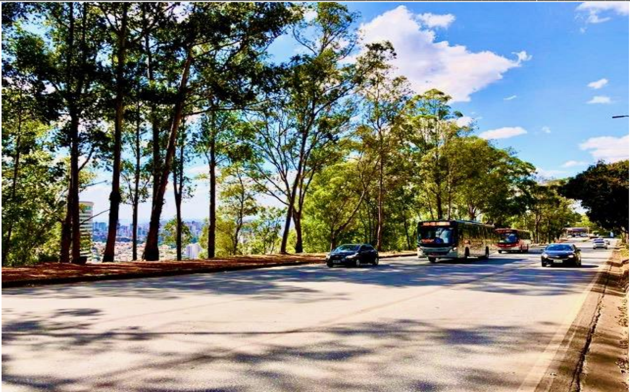
MGC-356 – LD