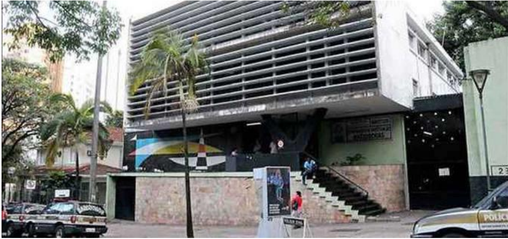
Imagem 2: Fachada do DOPS