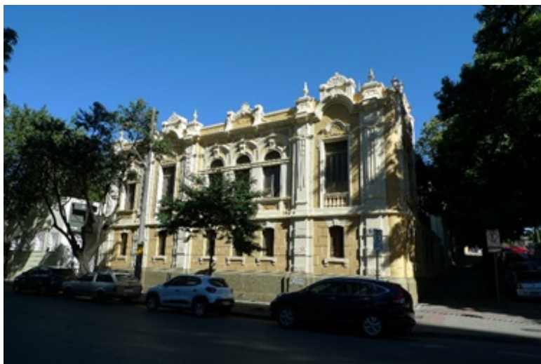
Imagem 2 - Edificação do Museu Mineiro - Acervo IEPHA/MG.

O edifício-sede do Museu foi construído em fins do século XIX, seguindo as orientações da Comissão Construtora da Nova Capital, em estilo eclético, com linhas básicas da arquitetura greco-romana e renascentista, apresentando um vocabulário ornamental afrancesado. Projetado inicialmente para servir de residência aos Secretários de Estado, o edifício-sede passou por mudanças de funcionalidade no século XX, preservando o uso público e as características que marcaram a fase inicial da cidade.