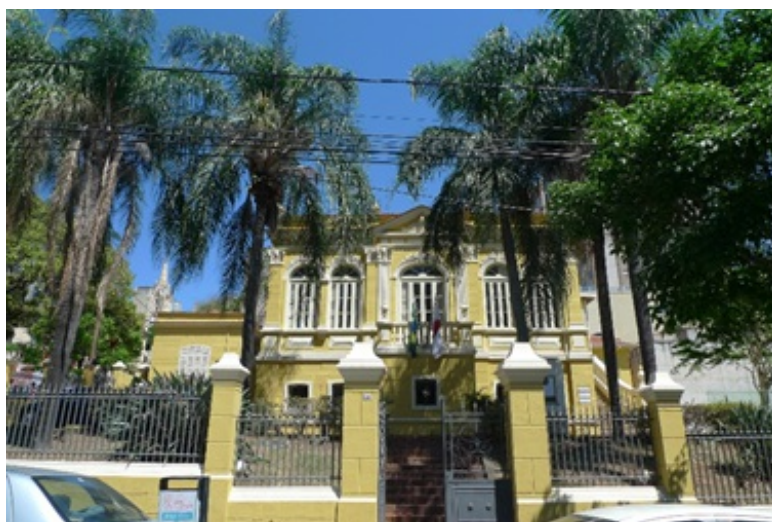
Imagem 1 – Edificação do Arquivo Público Mineiro.

O edifício-sede do Arquivo Público Mineiro foi construído em 1897 para ser a residência do Secretário de Finanças, segundo o projeto da Comissão Construtora da Nova Capital. A edificação apresenta dois pavimentos com varanda lateral e tem características da arquitetura eclética, com elementos clássicos nas fachadas. As adaptações realizadas no imóvel possibilitaram abrigar o amplo acervo documental do Arquivo Público Mineiro e incluíram a construção de um anexo em 1970. O APM passou por campanhas de restauração entre 1995 e 1998 e de 2006 a 2008.