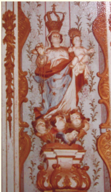
^ Nossa Senhora do Rosário

No século XIII, quando São Domingos organizou uma expedição para conversão espiritual dos heréticos da região de Albi, localizada no sul da França, reza a lenda que o santo suplicou a Virgem Maria que lhe indicasse uma arma espiritual eficaz, capaz de derrotar as seitas dos Albigenses e Cátaros.