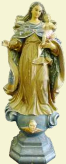
Nossa Senhora dos Prazeres Serro