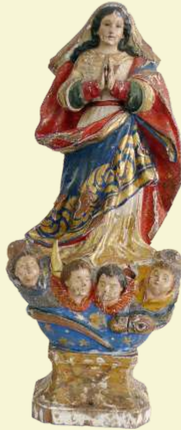
Nossa Senhora da Conceição Belmiro Braga