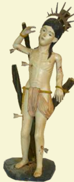
São Sebastião Belo Vale