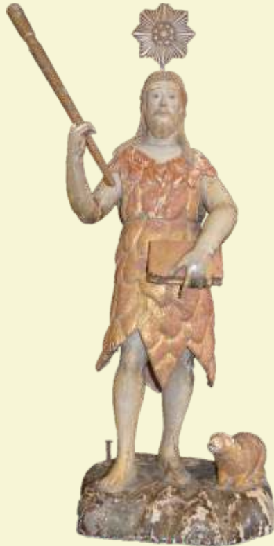
São João Batista Serro