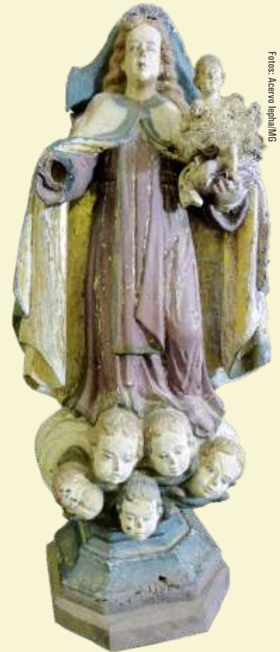
Nossa Senhora do Carmo Conceição do Mato Dentro