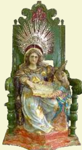
Santana Mestre Congonhas do Norte