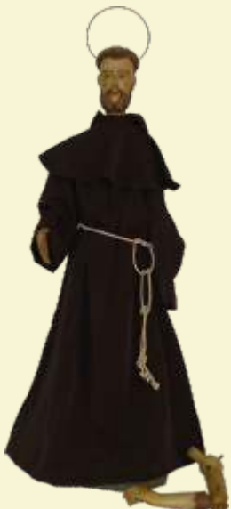
São Francisco de Assis Couto de Magalhães de Minas

Já em 2010 o Programa Restauração de Acervos restaurou dez imagens de nove municípios (Itapecirica, Chapada do Norte, Campanha, Santos Dumont, Berilo, Minas Novas, Couto de Magalhães de Minas, Córrego do Bom Jesus e Campo Belo). A novidade foi o blog Restauração Ateliê, com enorme número de acessos. Também em 2010, com a restauração das fontes das Três Graças (ou dos Desejos) e a da escultura da Moça Mirando Espelho D'água, na Praça da Liberdade, o Ateliê Vitrine inaugurou um novo formato: a restauração em espaços públicos. As pessoas que faziam caminhadas ou passavam de carro pela praça puderam acompanhar, dia a dia, as mudanças nas fontes.