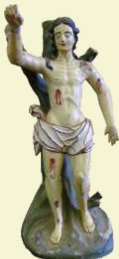
São Sebastião Piranga