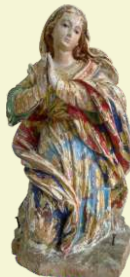
Nossa Senhora e São José (Conjunto da Natividade) Belmiro Braga