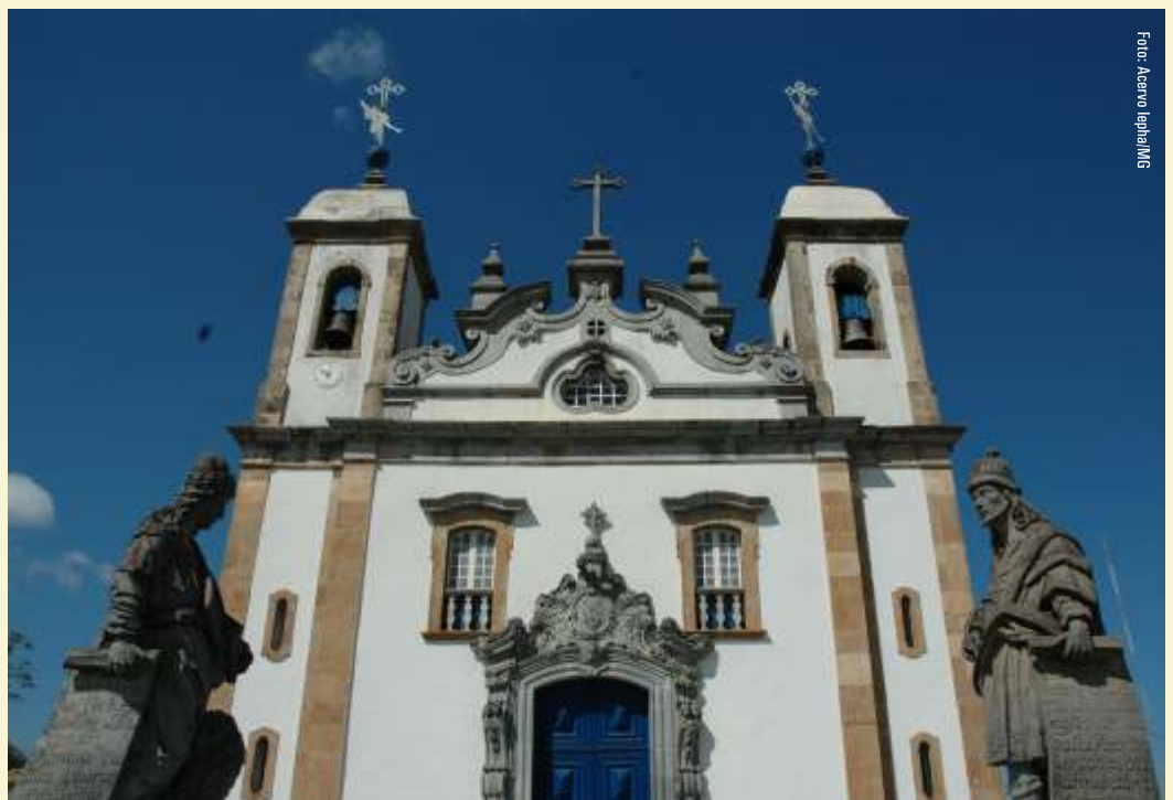
▲ Vista da Igreja Bom Jesus do Matozinhos com profetas, em Congonhas

Antônio Francisco Lisboa é considerado um dos principais artistas do Brasil do período colonial. Nascido em Ouro Preto na década de 1730, são de sua autoria esculturas, talhas e projetos arquitetônicos que são a marca do chamado estilo barroco mineiro. Falecido em 18 de novembro de 1814, um dos seus principais e últimos trabalhos são as esculturas dos Profetas e das Capelas dos Passos da