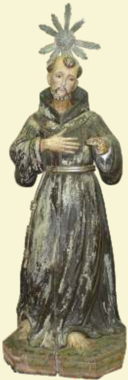
São Francisco Minas Novas