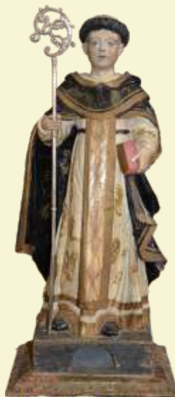
São Gonçalo Serro