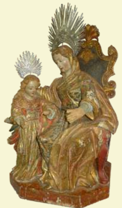
Santana Mestre Minas Novas

Durante todo o processo de restauração, o blog Restauração de Acervos, que pode ser acessado no site do Iepha, ficará novamente online. Quinzenalmente serão postadas fotos e comentários sobre o processo de restauração, possibilitando que as pessoas, mesmo de longe, possam conhecer e acompanhar o trabalho.