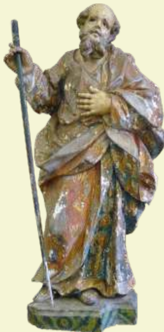
São Joaquim Chapada do Norte