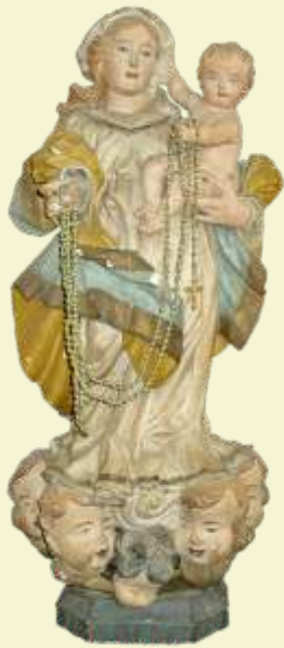
Nossa Senhora do Rosário Conceição do Mato Dentro