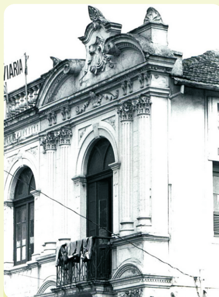
▲ Ficha de inventário realizada pelo IEPHA em 1988 apontava algumas descaracterizações no prédio

De ornamentação elaborada, a edificação apresenta um quadro central com duas janelas no segundo pavimento, ladeadas por duas sacadas dispostas em cada uma das laterais e resguardadas por guarda-corpo em ferro trabalhado. Destacam-se ainda na edificação as colunas de inspiração clássica que conferem elegância ao prédio, que dentre outros usos, já abrigou uma pensão.