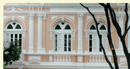
▲ Janelas do pavimento superior ladeadas por colunas encimadas por capitel que mescla os estilos coríntio e jônico

A arquitetura e o espaço urbano deveriam refletir as novas ideias, decretando o fim de uma era representada pela imagem das velhas casas primitivas do Curral Del Rei. Para proclamar os novos tempos, o estilo eclético foi escolhido por representar riscos modernos no espaço urbano da nova capital do estado.