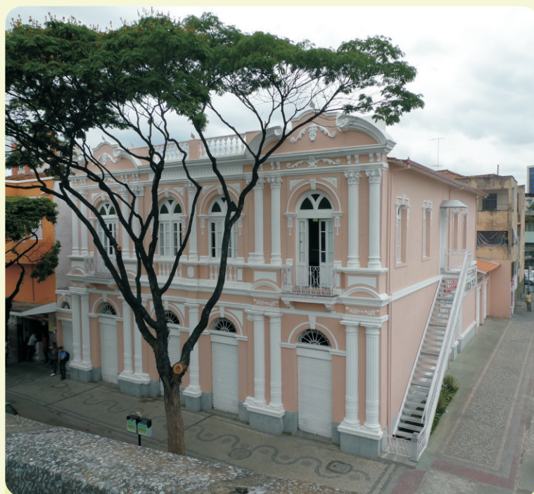
▲ Com ornamentação elaborada, prédio é um dos exemplares do estilo eclético em BH

Antes abandonado e descaracterizado em suas linhas construtivas, o casarão retomou sua beleza com processo de restauração que devolveu elementos ornamentais como os motivos florais.