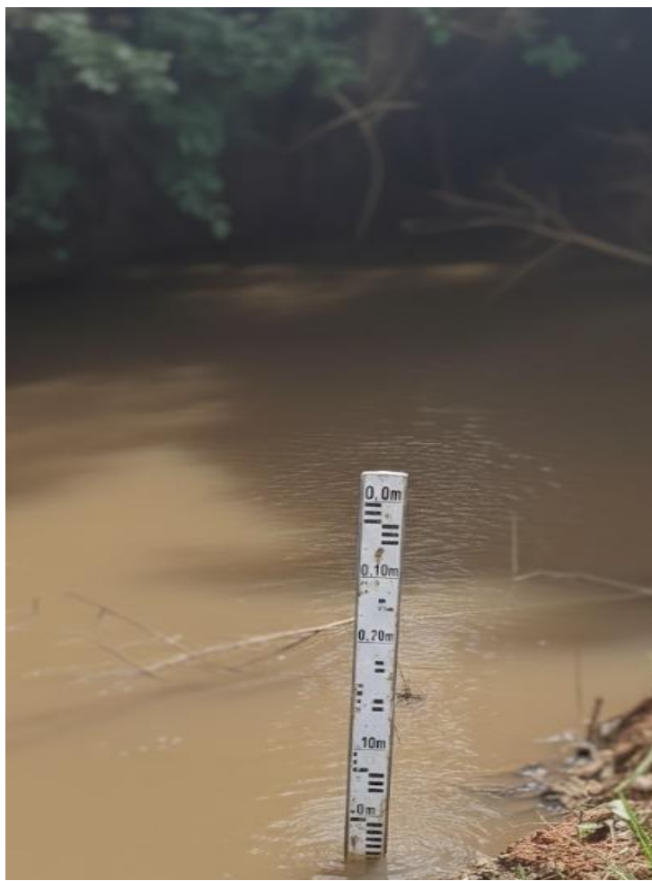
ANEXO 01 E 02