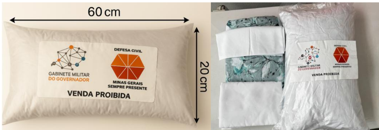
Imagem 3 – Kit Dormitório