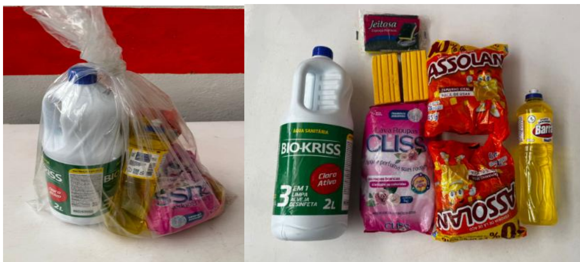
Imagem 4– Kit Limpeza