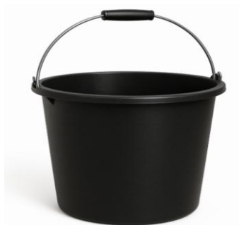
Imagem 5– Balde