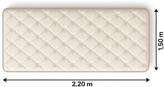
Imagem 7– Colchão