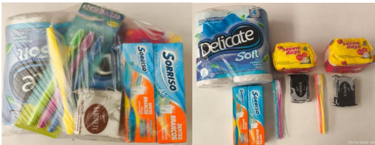
Imagem 2 – Kit Higiene