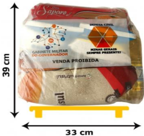
Imagem 1 – Cesta básica